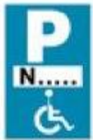
(P - 72)