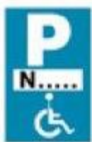
(P - 72)