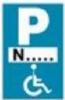
(P - 72)