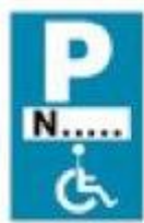
(P - 72)