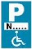
(P - 72)