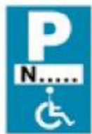
(Ρ - 72)