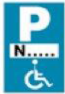
(P - 72)

4. Μία (1) πινακίδα Πρ-4γ (Τέλος ισχύος πινακίδας P-72 που τοποθετείται κάθετα προς τον άξονα της οδού).