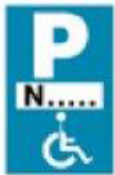
(Ρ - 72)

4. Μία (1) πινακίδα Πρ-4γ (Τέλος ισχύος πινακίδας Ρ-72 που τοποθετείται κάθετα προς τον άξονα της οδού).