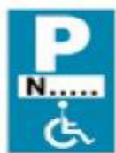
(Ρ - 72)

4. Μία (1) πινακίδα Πρ-4γ (Τέλος ισχύος πινακίδας Ρ-72 που τοποθετείται κάθετα προς τον άξονα της οδού).