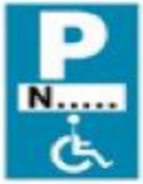
(Ρ - 72)