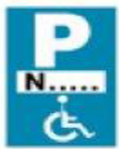
(Ρ - 72)

4. Μία (1) πινακίδα Πρ-4γ (Τέλος ισχύος πινακίδας Ρ-72 που τοποθετείται κάθετα προς τον άξονα της οδού).