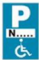
(P - 72)

4. Μία (1) πινακίδα Πρ-4γ (Τέλος ισχύος πινακίδας P-72 που τοποθετείται κάθετα προς τον άξονα της οδού).