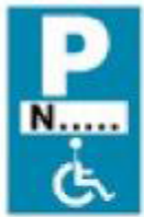
(P - 72)

4. Μία (1) πινακίδα Πρ-4γ (Τέλος ισχύος πινακίδας P-72 που τοποθετείται κάθετα προς τον άξονα της οδού).